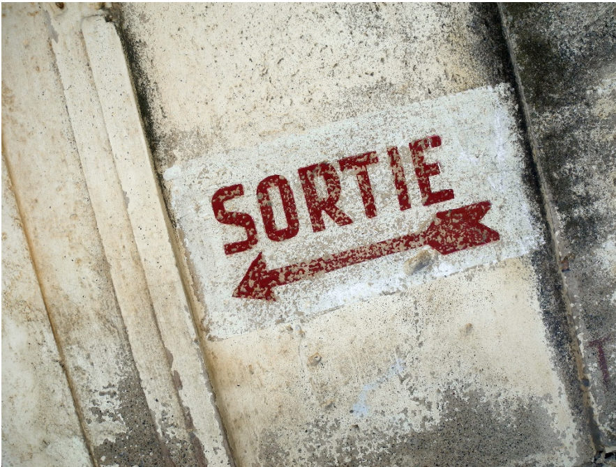
Schild am Wanderweg Chemin Walter Benjamin . Der Weg wurde im nationalsozialistisch besetzten Frankreich von ca. 50.000 Flüchtlingen genutzt, um von den Grenzkontrollen unbemerkt nach Spanien zu gelangen.